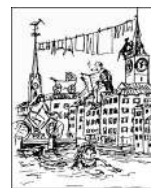
Einwohnerverein Altstadt links der Limmat