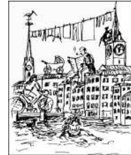
Einwohnerverein Altstadt links der Limmat