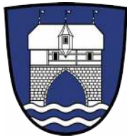
Quartierverein Zürich 1 rechts der Limmat