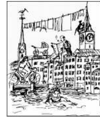
Einwohnerverein Altstadt links der Limmat