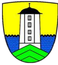
Quartierverein Selnau- City